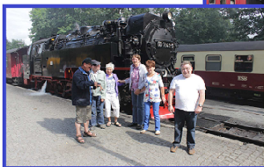
Station Drei Annen Hohne

Even een kopje thee drinken en ons wat oprispen en dan is het al weer tijd om uit eten te gaan. We gaan deze keer naar Wendefürth, naar hotel/restaurant Zur Bode. Daar hebben we weer heerlijk gegeten. Weer terug in 'ons huis' blijkt dat we allemaal best wel zin hebben om ons bed op te zoeken en onder ons donzen dekbed te kruipen. Want morgen moeten we vroeg uit de veren. WELTERUSTEN!