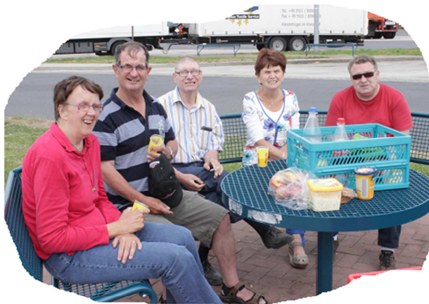
Picknick op de autobahn

We rijden weer door Wernigerode heen en zien bekende plekken van de dag er voor, toen we daar op de trein stapten. Al gauw komen we op de snelweg en kunnen dan goed door rijden. We houden een paar korte pauzes en nemen wat meer tijd voor een picknick op één van de parkeerplaatsen.