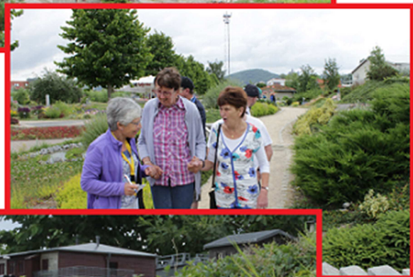
Miniatuurpark Kleine Harz, Wernigerode.